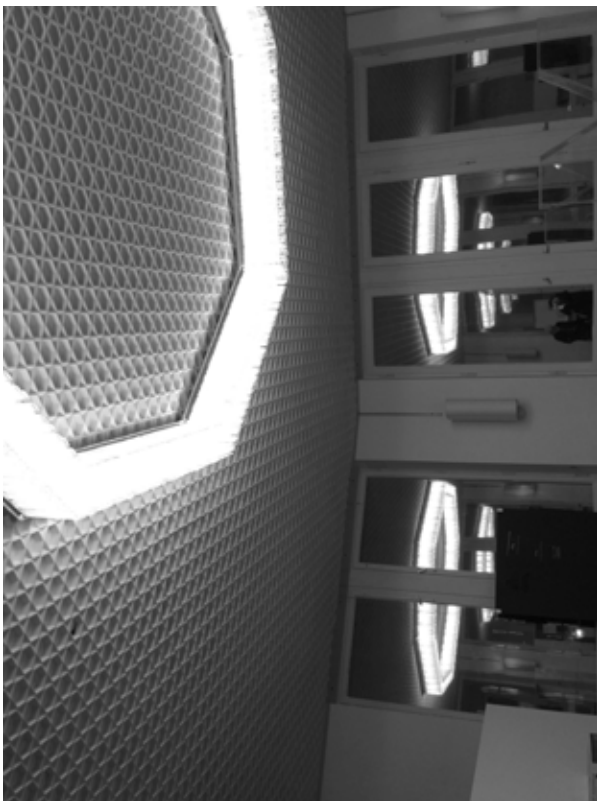
Schinkel Pavillon upside down