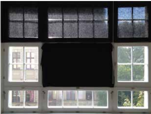
DAY IN DAY OUT Lin, lumière du soleil Toile sur châssis 77 cm x 286 cm

L'installation présente la juxtaposition de deux pièces : DAY IN DAY OUT et SCARABOCCHIO . Une analogie opère entre le processus d'inscription qui a participé à la création des oeuvres et sa réception par le spectateur. Ainsi les gribouillages comme actes désinvoltes et soudains se donnent à voir directement tandis que le la « photographie » de la fenêtre se dévoile en demandant un effort rétinien.