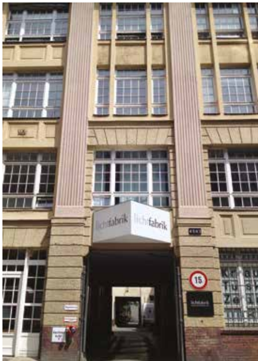
KB, entrée Kohlfurter Strasse