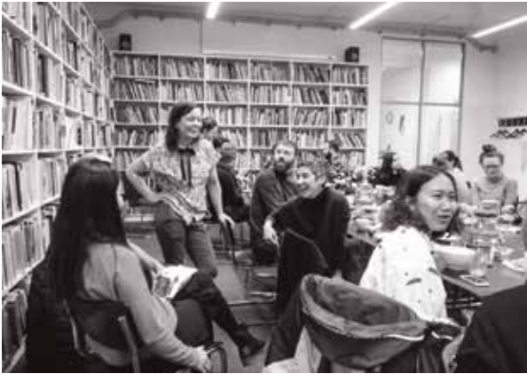
Breakfast Club, novembre 2018, © Peter Rosemann