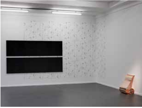
Vue de l'exposition After all this time, always. Künstlerhaus Bethanien, Berlin.