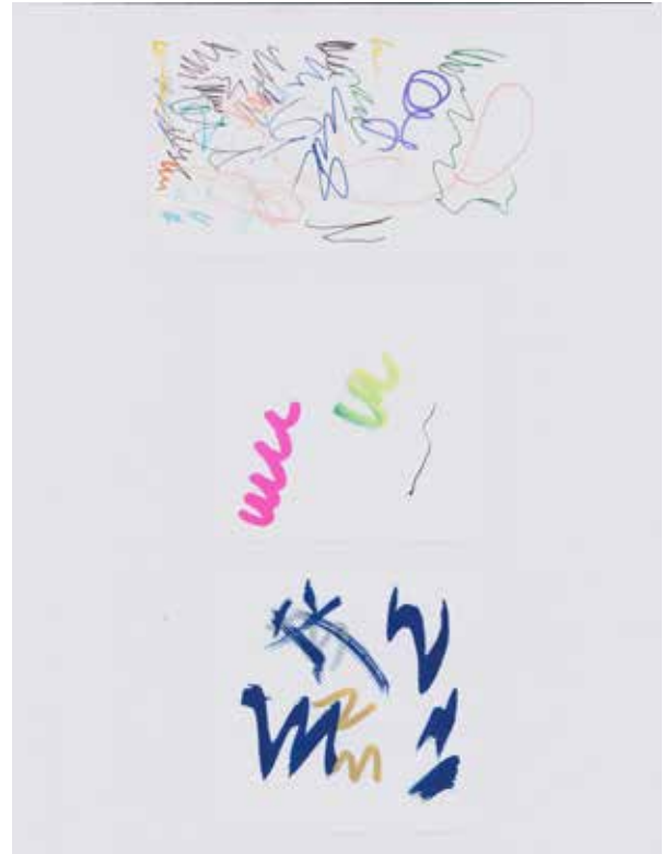
Prémices de la pièce Scarabocchio