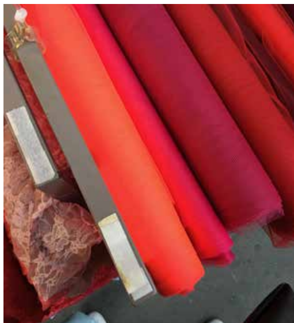
À la recherche de matériaux

Ces ateliers ne demandaient pas plus de 5 minutes; gardant en tête qu'il y avait déjà beaucoup d'évènements planifiés lors de mon séjour, je ne voulais pas ajouter encore plus de choses à faire au calendrier des résidents. Alors que certains ne sont restés que 5 ou 10 minutes, d'autres ont tout de même participé pendant presque une heure.