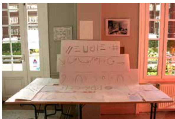
Le résultat de l'atelier et l'installation à la galerie de la Fondation Biermans-Lapôte

Résidence de recherche à la Fondation Biermans-Lapôte, Paris BOURSE GG-FBL