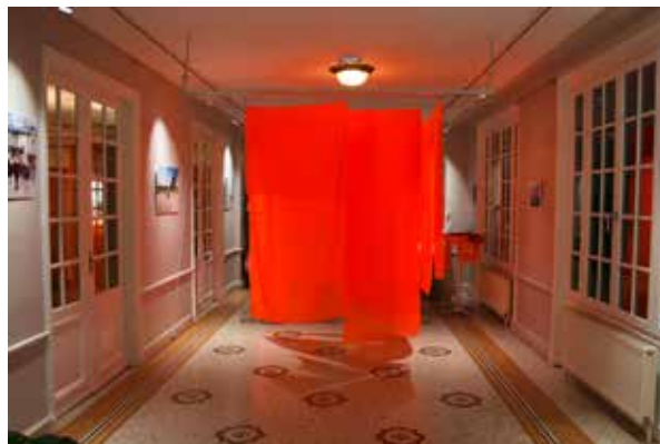
L'installation à la galerie de la Fondation Biermans-Lapôte