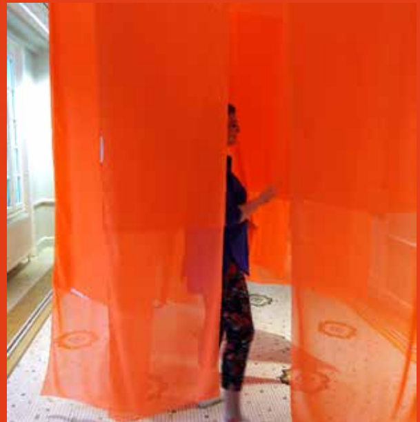
L'installation à la galerie de la Fondation Biermans-Lapôte

Dans le cadre de la Luxembourg Design Biennale 2016, ses deux projets sur le Luxembourg et les langues au Luxembourg en collaboration avec des artisans luxembourgeois ont fait partie de l'exposition Local Craft Meets Design avec le collectif In Progress au Cercle Cité: Luxembourg(ish) , un set de verres typographiques, et &Luxembourg , des carnets inspirés par des bâtiments luxembourgeois.