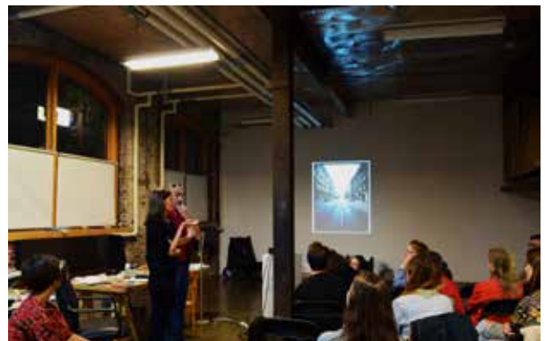
De haut en bas, première et deuxième photos Troisième photo : Talk Radek Bruno Leonora