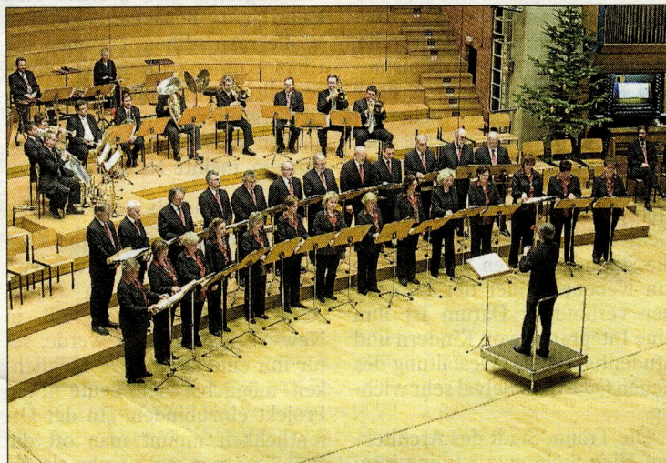
Die Musiker des „Luxembourg Brass Ensemble“ sind seit Anbeginn beim Projekt „Christmas Carols“ dabei.

„Christmas Carols“ im Musikkonservatorium Luxemburg